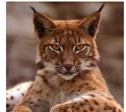
Luchs – Tier des Jahres 2011